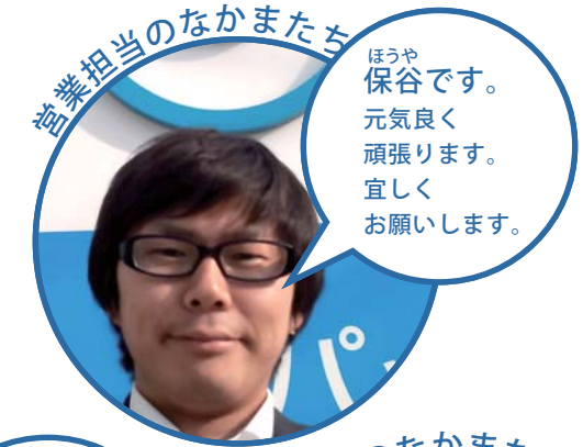
営業担当のなかまたち