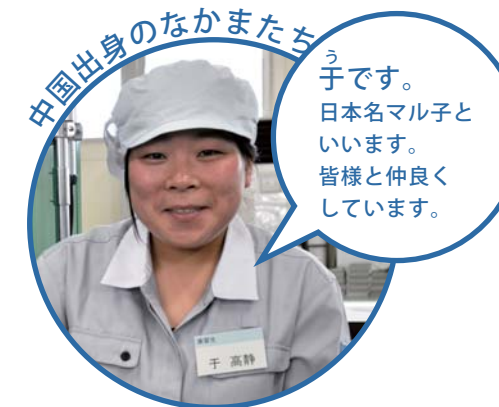
中国出身のなかまたち