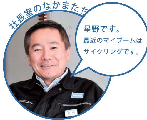
社長室のなかまたち