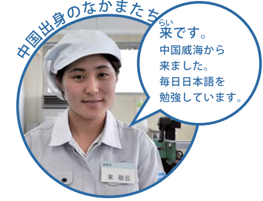
中国出身のなかまたち