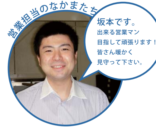
営業担当のなかまたち