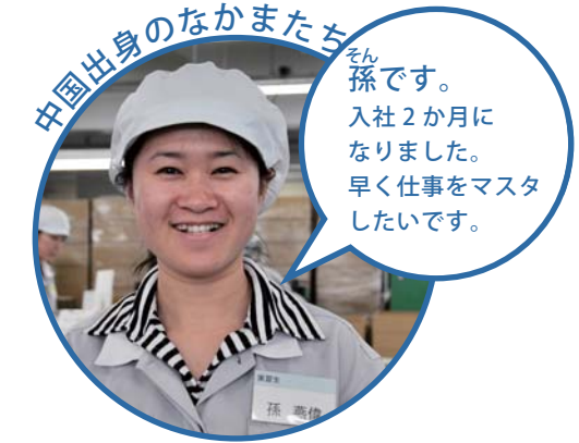
中国出身のなかまたち