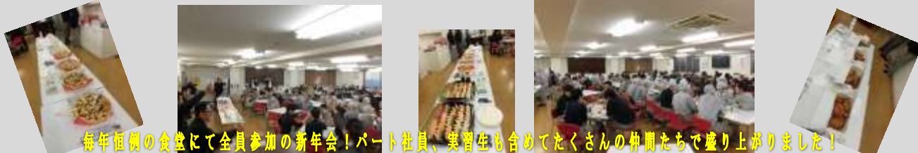
毎年恒例の食卓にて全員参加の新年会！パート社員、実習生も含めてたくさんの仲間たちで盛り上がりました！