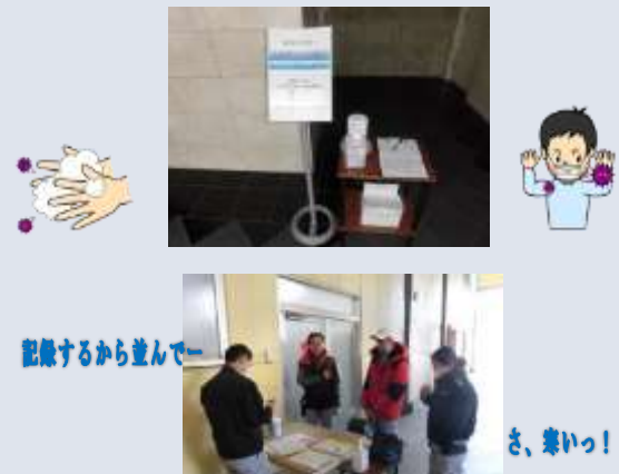
記録するから並んでー