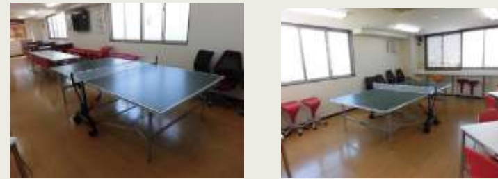
コロナ終息後卓球大会開始予定！