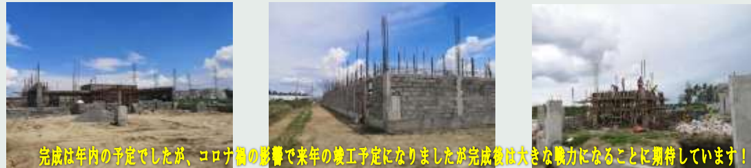
完成は年内の予定でしたが、コロナの影響で来年の竣工予定になりましたが完成後は大きな戦力になることに期待しています！