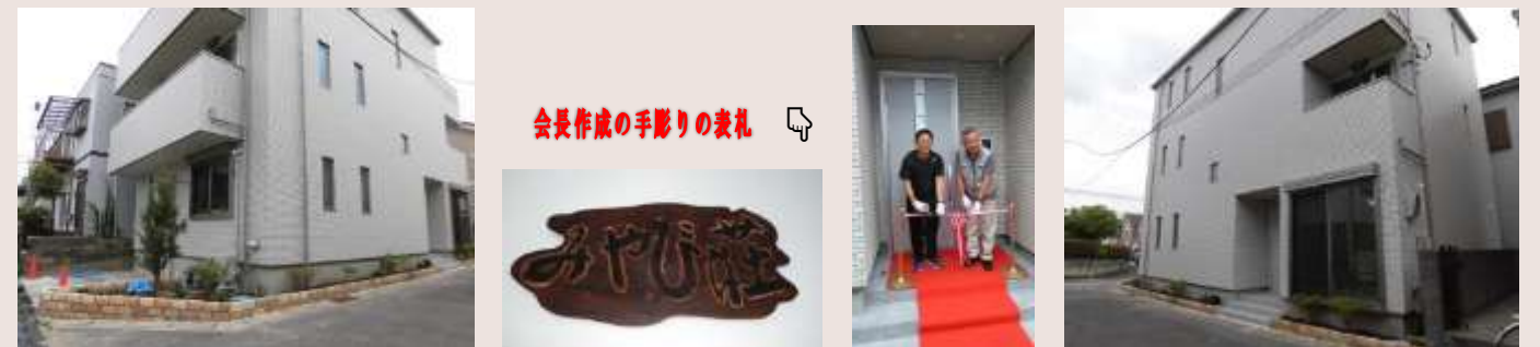
会長作成の手彫りの表札