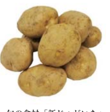
旬の食材「新じゃがいも」