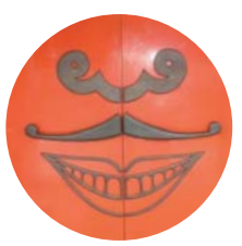
4月1日「エイプリルフール」