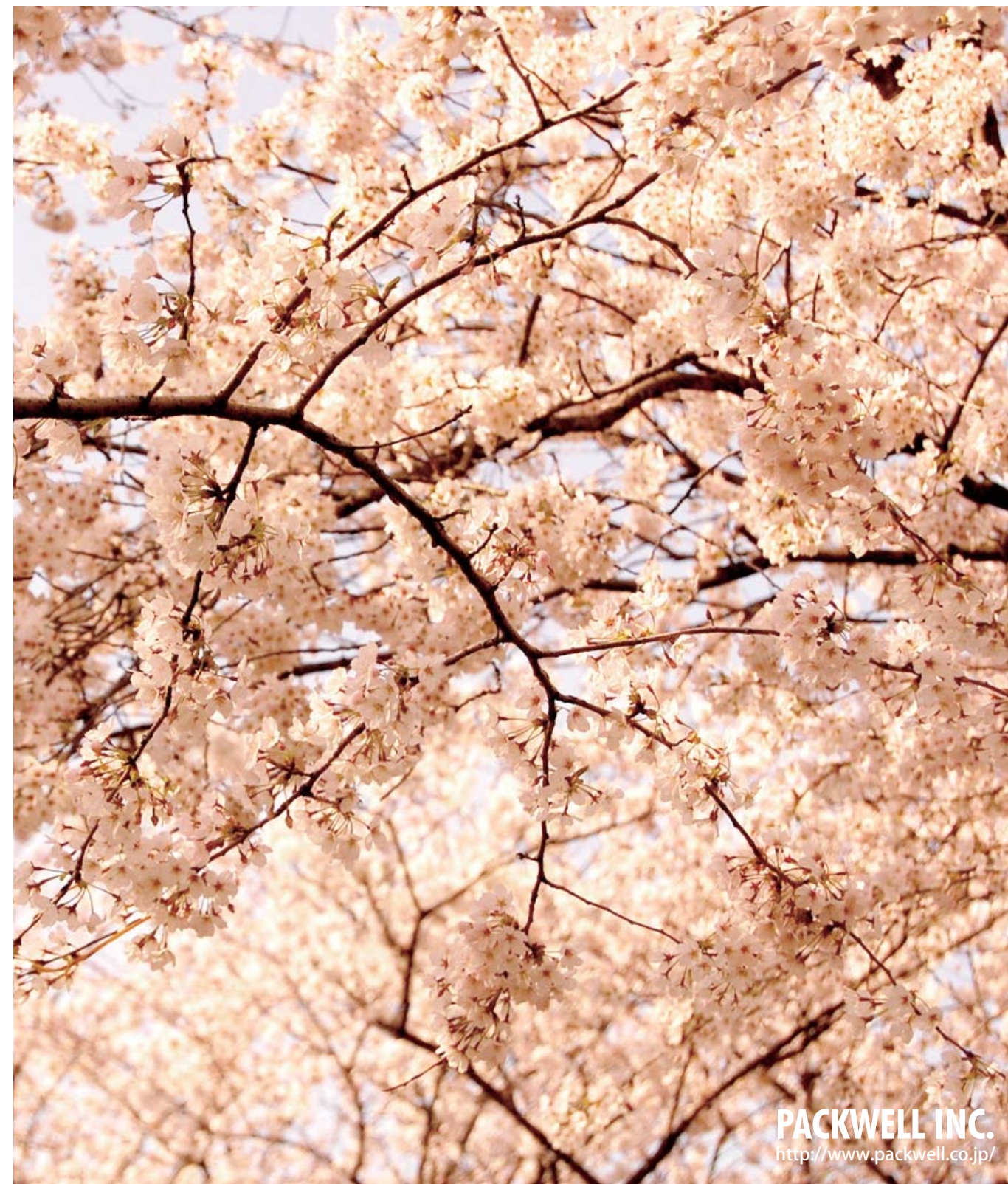
窓あけて窓いつぱいの春 種田 山頭火