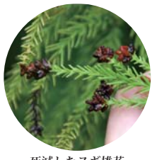
死滅したスギ雄花